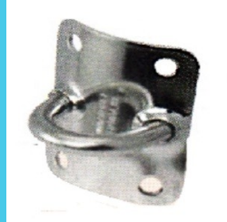
Mastplatte zum Anschäkeln vertikal