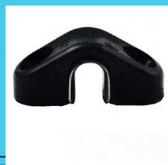
Leitösen für Taue bis 8mm