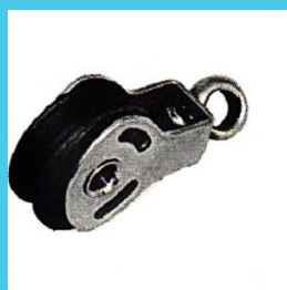
Umlenkrolle die mit Ösen zu befestigen sind