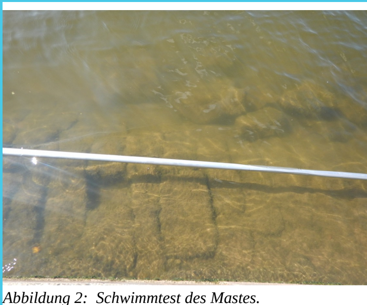
Abbildung 2: Schwimmtest des Mastes.

Fragen zur technischen Konfiguration, Modellfeststellung des Bootes in das der Mast eingebaut werden soll, Vermessung im Vorfeld unverbindlich an: derflusswanderer@posteo.de